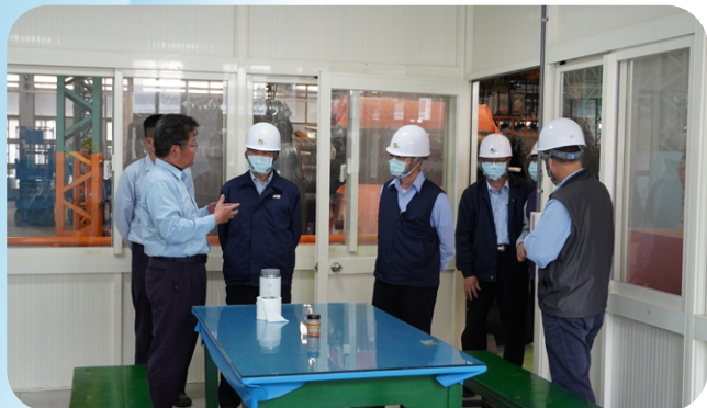
3/21 頭份總廠廠區主管陪同林副董事長巡廠