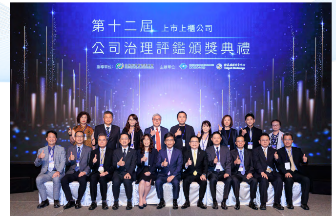
頒獎人與受獎代表合照

公司治理是企業永續經營的基石。此次集團旗下四家公司同時獲得公司治理評鑑的肯定，不僅是對經營團隊與全體同仁推動誠信經營、ESG（環境、社會、公司治理）績效的重大鼓舞，未來集團也將持續精進，以更高標準落實公司治理，為股東、員工及社會大眾創造長遠價值的最大化。